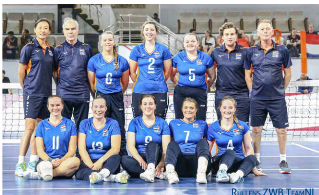
RULLENS ZWB TEAMNL

"We zouden onze wedstrijden om de Worldcup in Caïro spelen, maar vanwege de oorlog in de Gazastrook werd om veiligheidsredenen uitgeweken naar New Caïro, de in aanbouw zijnde toekomstige hoofdstad van Egypte. We logeerden in het luxe hotel Tolip International Olympic City. Het hotel heeft vijf zwembaden en een grote fitnessruimte. Vanwege de veiligheid werden alleen deelnemende teams in het hotel ondergebracht.