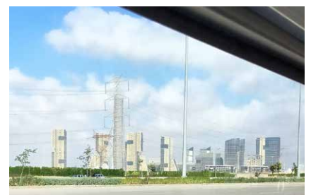
ZWB WOLKENKRABBERS AAN DE HORIZON.

sporthal regelmatig af van het geplande tijdschema. De toegezegde begeleiding door de politie was de eerste dagen niet altijd aanwezig. Gelukkig waren de opstartproblemen na de tweede dag opgelost.