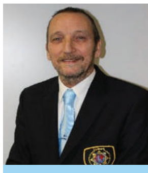
JAC COUVEE SECRETARIS / LEDENSECRETARIS

IPA, p.a. Nijmegenstraat 10, 6415 BK Heerlen. T 06 20 37 51 99 E pm-limburg-zuid@ipa-nederland.nl