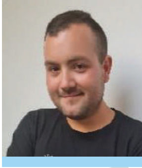
JOS HARDY BESTUUR ONDERSTEUNER

Ipa, p.a. Nijmegenstraat 10, 6415 BK Heerlen. T 06 42 71 82 19 E best2-limburg-zuid@ IPA-Nederland.nl