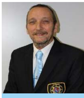
JAC COUVEE SECRETARIS / LEDENSECRETARIS

IPA, p.a. Nijmegenstraat 10, 6415 BK Heerlen. T 06 20 37 51 99 E pm-limburg-zuid@ipa-nederland.nl