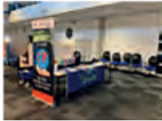
Politie Academies Toezicht