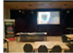
Politie Academies Toezicht