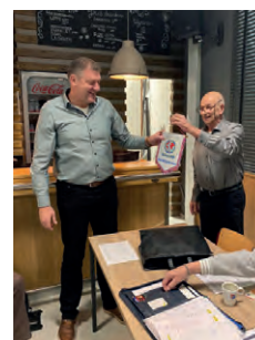
OOK DE GASTHEER WERD VOORZIEN VAN EEN ATTENTIE