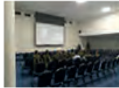
Politie Academies Toezicht