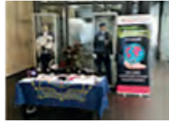
Politie Academies Toezicht