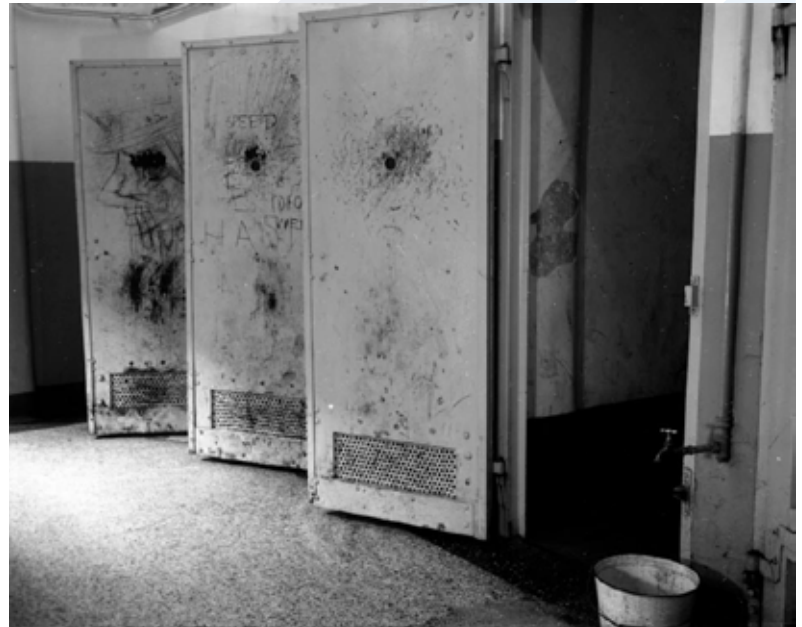
DRONKENMANSCEL VOORMALIG POLITIEBUREAU VRIJTHOF, MAASTRICHT