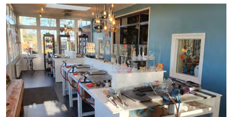
DE WERKPLAATS (BOVEN) EN DE WINKEL (ONDER) WWW.GLASBLAZERIJMARTORELL.NL

van glas een lepeltje met op de kop een klein engeltje met flinterdunne vleugeltjes. Het was schitterend om te zien hoe hij dat allemaal voor elkaar kreeg. ■