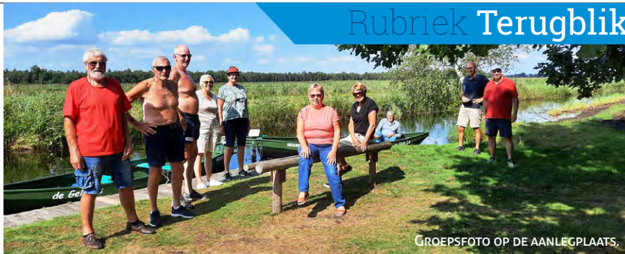
GROEPSFOTO OP DE AANLEGPLAATS.